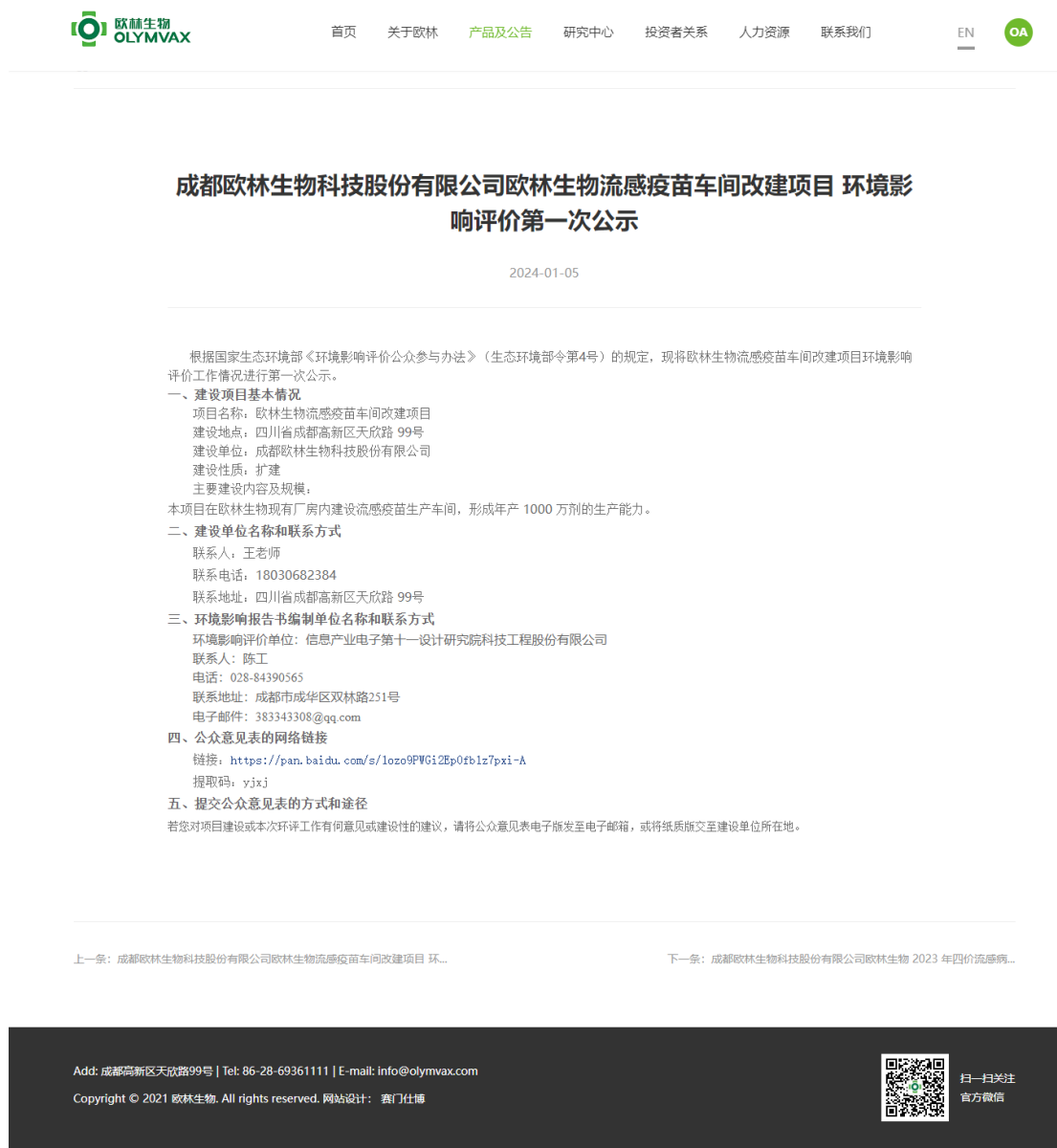
图 1 欧林生物官方网站第一次网络公示截图