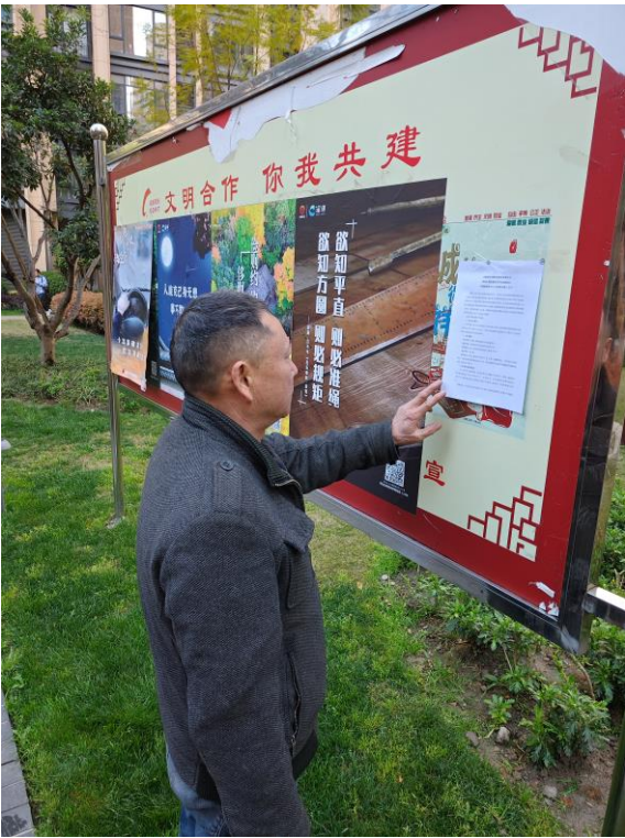
图 5-1 龙湖时代天街公示张贴照片

成都欧林生物科技股份有限公司在龙湖时代天街张贴了公示公告，时间为 2024 年 3 月 22 日~2024 年 4 月 8 日（10 个工作日）。该公开地点易于公众接触和阅读。张贴现场照片如下所示：