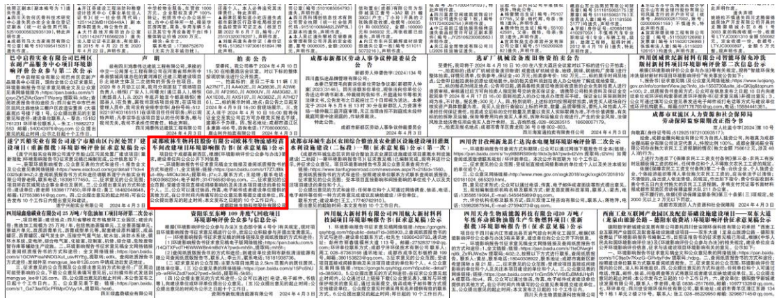
图 4 2024 年 4 月 3 日四川科技报公示截图